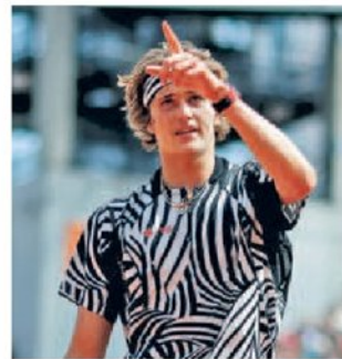
Geschlagen. Youngster Alex Zverev verlor auch das dritte Duell mit Thiem.

Mit Fortdauer der Partie übernahm der Niederösterreicher aber das Kommando – nach 2:49 Stunden verwertete er seinen ersten Matchball. „Es war schwer“, bilanziert Thiem. „Jetzt gilt es, meine ganzen Kräfte für Montag zu sammeln.“